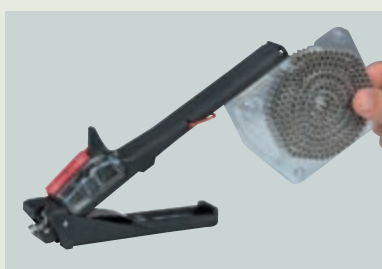
② Установка кассеты большой вместимости