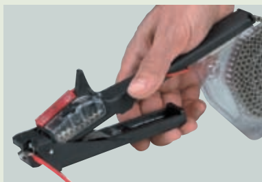
③ Опрессовка наконечников