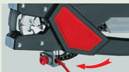
③ Опрессовка: вставьте провод в наконечник Starfix и произведите опрессовку