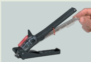
① Установка обычной кассеты