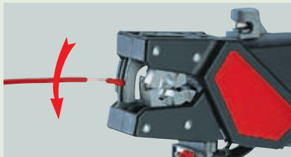
② Скручивание: вставьте многожильный провод между губками инструмента, не снимая изоляцию до конца, и произведите скрутку