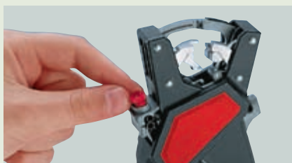
① Настройка инструмента позиция I - 0.5 - 1 мм 2 позиция II - 1.5 - 2.5 мм 2